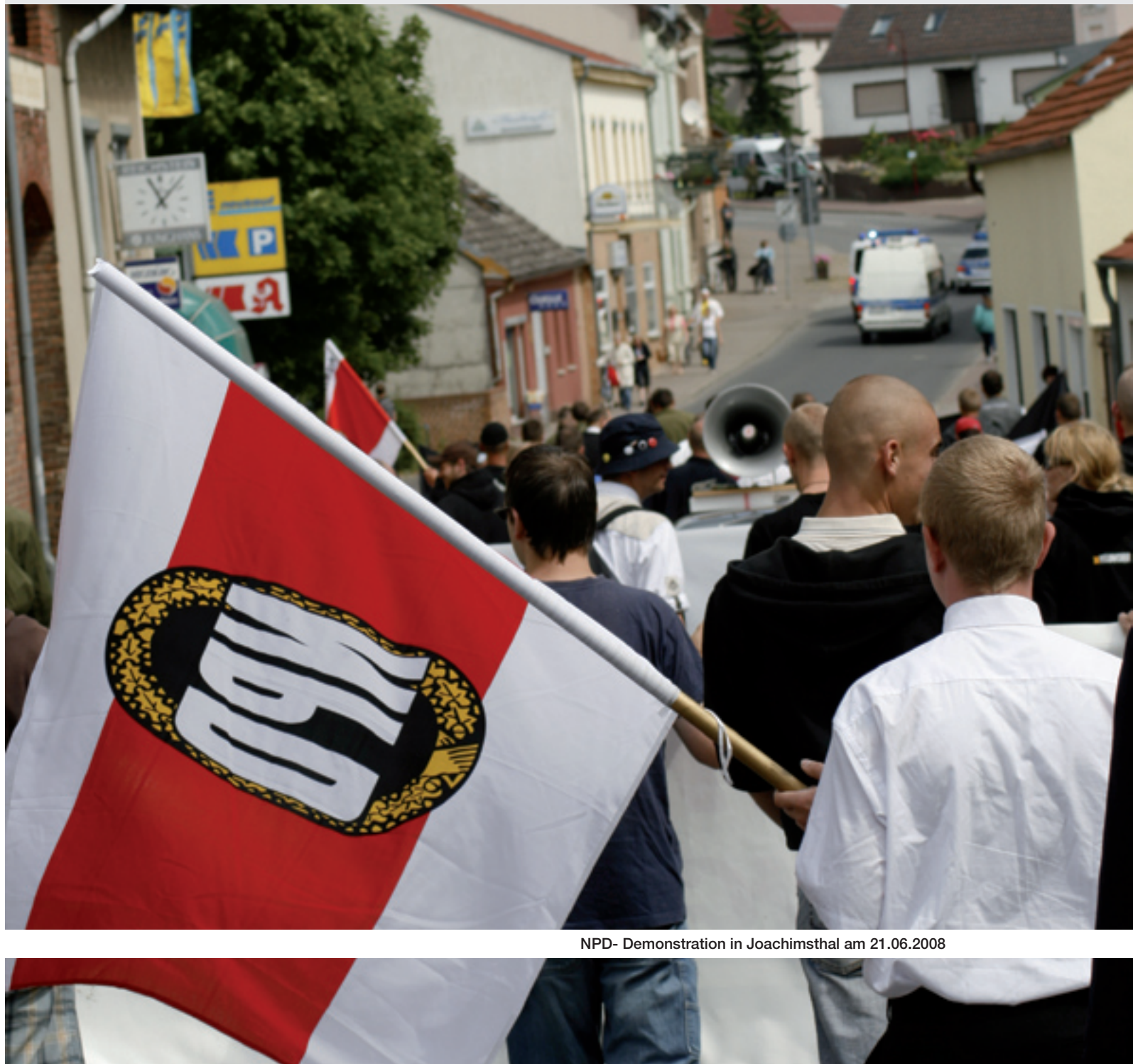
NPD- Demonstration in Joachimsthal am 21.06.2008

INFOBROSCHÜRE FÜR BERNAU UND UMGEBUNG :: SEITE 4