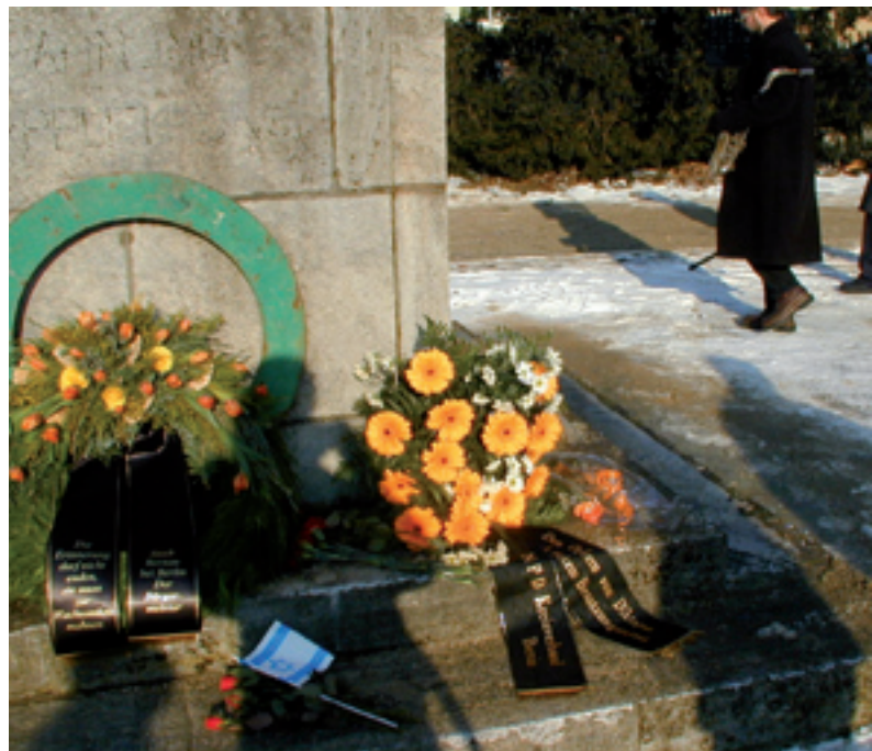
NPD - Kranz bei Kranzniederlegung am 27.01.2006 in Bernau

In den letzten Jahren waren in Schönow lediglich vereinzelte rechte Aktivitäten wahrzunehmen. Diese äußerten sich u.a. durch Aufkleber sowie an Häuserwände gesprühte Hakenkreuze. Meist blieb dies unbemerkt, zumindest störte sich kaum jemand daran. Einige politisch Verantwortliche sorgten sich mehr um den Ruf des Ortes als um die Informationen der Schönower_innen und eine klare Positionierung gegen Nazis in ihrem Ort. So konnten auch der Landesparteitag der Brandenburger NPD im Dezember 2007 sowie weitere Treffen der Partei in einer Gaststätte im Ort ungestört stattfinden. Erst ein größerer „Kameradschaftsabend“ im März 2008 schaffte es mit einer kurzen Notiz in die lokale Zeitung. Versuche von Polizei, Beratungsstellen und engagierten Bürger_innen mit der Besitzerin der Gaststätte ins Gespräch zu treten und diese von der Zusammenarbeit mit der NPD abzubringen, scheiterten. Viele Bürger_innen aus dem Umfeld der Gaststätte sympathisieren mit dieser