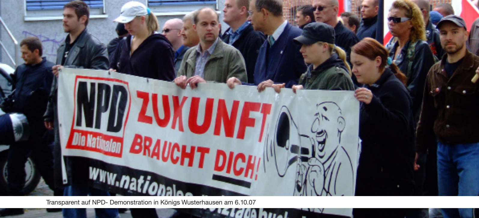
Transparent auf NPD- Demonstration in Königs Wusterhausen am 6.10.07

tionales Bündnis Preußen“, welche sie nach eigenen Angaben „reaktivierten“, half ihnen bei zunehmenden Aktivitäten. Erste größere Aktivitäten zeigten sich 2008, als es hieß, die NPD wolle in Biesenthal das ehemalige Asylbewerberheim als Schulungszentrum nutzen (mehr dazu unter 2. Schwerpunkte neonazistischer Aktivitäten). In Joachimsthal organisierten sie am 21. Juni 2008 ihre erste eigene Demonstration mit der Forderung nach einer „Todesstrafe für Kinderschänder“. Mittlerweile hat es die NPD Barnim/ Uckermark neben einer funktionierenden Internetpräsenz zu eigenen Flyern und zu einer Zeitung gebracht. Die Aktivitäten werden in Vorbereitung auf die Landtagswahlen 2009 nicht abbrechen. Dank ausgebauter Kontakte innerhalb der Szene, von rechtsextremer Musik, über Kameradschaften und Vereine ist sogar mit einer Zunahme zu rechnen.