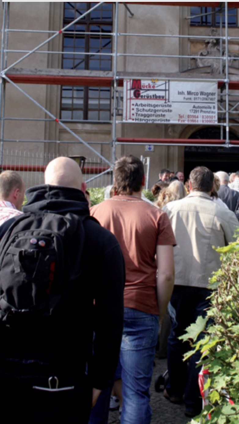
Friedensgebet gegen NPD Schulungszentrum am 25.05.2008 in Biesenthal

INFOBROSCHÜRE FÜR BERNAU UND UMGEBUNG :: SEITE 8